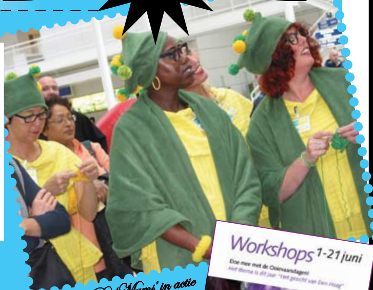
De 'Mums' in actie

maken + Arbeiderswoning ontwerpen en maken