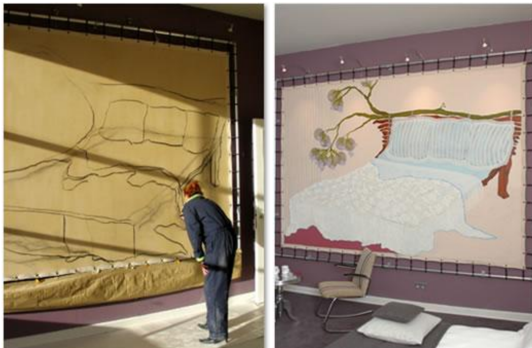
kunstenaar Liesbeth van Ginneken sponsor www.royaltalens.com

Eveneens gesitueerd in het slaapvertrek een monumentaal olieverfschilderij van ondergetekende met de titel 'Een gespreid bedje 2008'. Het schilderij meet 3 m x 4 m en is daarmee het grootste doek uit mijn 20-jarige carrière. Het werk is ter plekke op locatie geschilderd tijdens de bouwwerkzaamheden in het pand. Koninklijke Talens leverde de benodigde olieverf uit de series Rembrandt, Van Gogh en Amsterdam alsook alle penselen en diverse mengmiddelen.