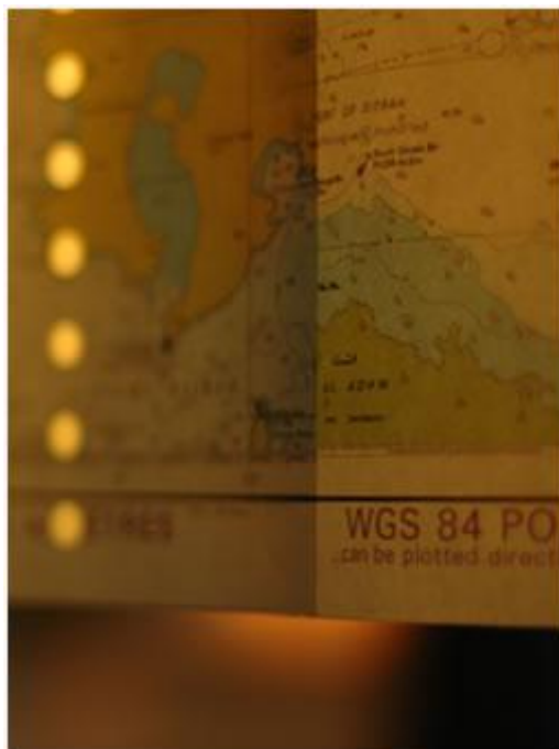
kunstenaar Michael Bom www.bomdesign.nl